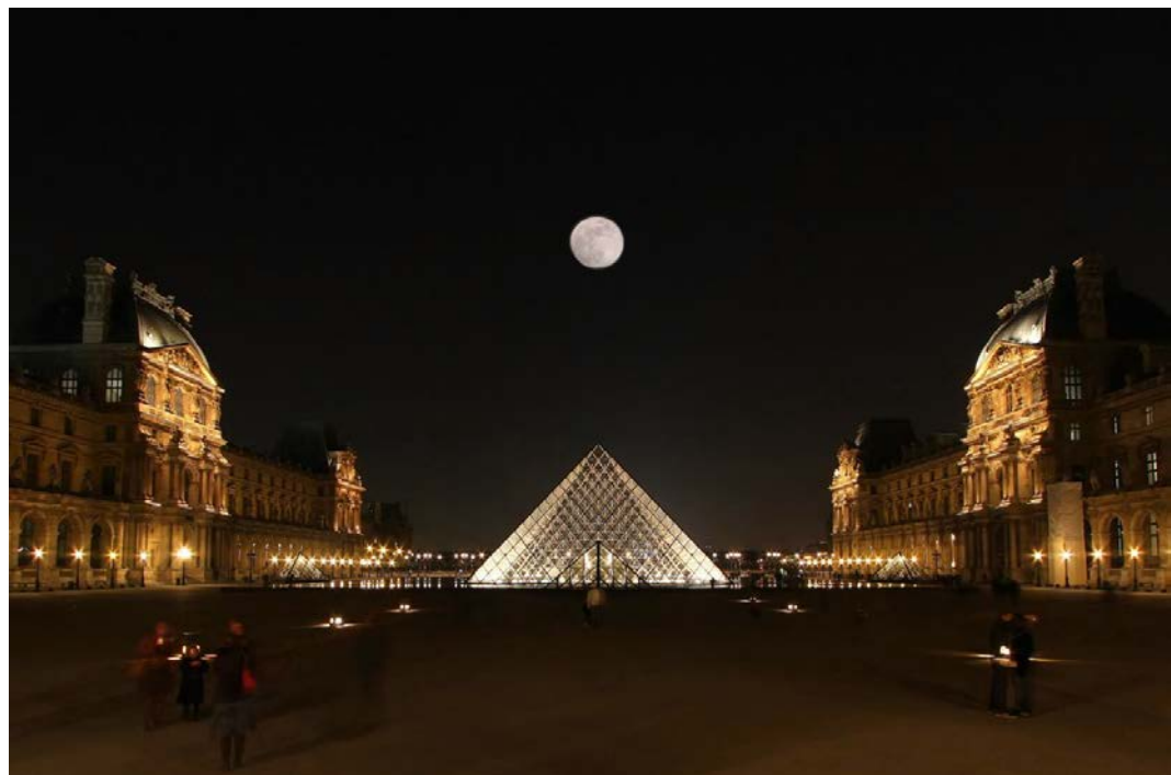
De ERNOP-conferentie 2015 vindt plaats in Parijs.

Het Europese netwerk van onderzoekers op het gebied van filantropie ERNOP blijft groeien. Begin juli houdt ERNOP zijn tweejaarlijkse conferentie in Parijs, en er zijn meer papervoorstellen ingediend dan ooit. Het succes van het onderzoeksnetwerk, opgericht in 2008 door VU-wetenschappers en collega's uit heel Europa, toont aan dat filantropie een uiterst relevant onderzoeksveld is.